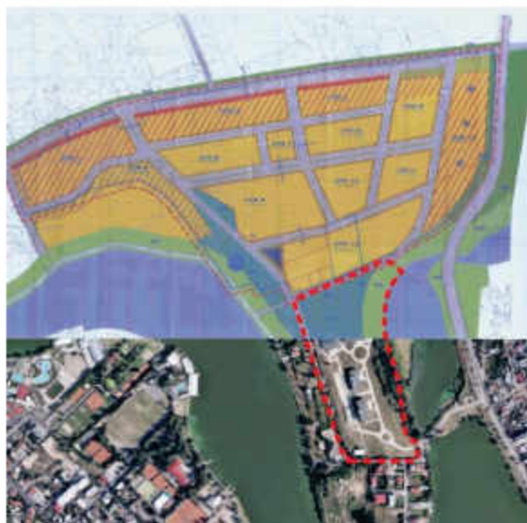
P.U.Z. Șos Fabrica de Glucoză nr 6-8 aprobat aprobat prin HCGMB nr 87/28.04.2011, în prezent expirat

Conform P.U.Z. Șos Fabrica de Glucoză nr 6-8 aprobat prin HCGMB nr 87/28.04.2011 , în prezent expirat, terenul are acces reglementat dinspre Șos Fabrica de Glucoză