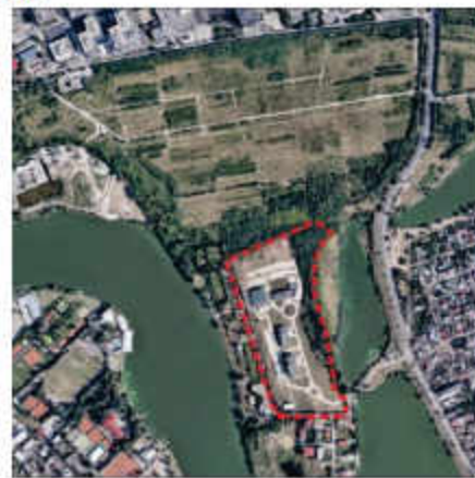
P.U.Z. Sector 2 aprobat prin HCL nr 99/2003 prelungit cu HCL nr 5/ 2013, în prezent expirat

Conform P.U.Z. Șos Fabrica de Glucoză nr 6-8 aprobat prin HCGMB nr 87/28.04.2011 , în prezent expirat, terenul are acces reglementat dinspre Șos Fabrica de Glucoză