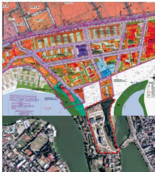
Actualizare și modificare P.U.Z. Șos Fabrica de Glucoză nr 6-8 în curs de avizare

Conform Documentației "Actualizare și modificare P.U.Z. Șos Fabrica de Glucoză nr 6-8", în prezent în curs de avizare, terenul are acces reglementat dinspre Șos Fabrica de Glucoză.