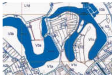
Extras din PUG București

Planul Urbanistic Zonal al Sectorului 2 presupune un proces de integrare a reglementărilor Planului Urbanistic General București, documentațiile în vigoare și cele în curs de aprobare și în același timp răspunzând necesităților utilizatorilor.